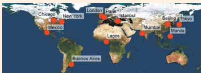
Table ronde sur les 12 Mégapoles

Synthèse des monographies , Blanca Elena Jiménez Cisneros, UNESCO PHI